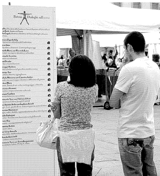
CARTELLONE Tanti gli appuntamenti in programma nelle piazze e nei teatri: i biglietti si potranno comprare anche sul posto

Concesse due deroghe straordinarie: in occasione dei Dialoghi gli esercizi commerciali del centro resteranno aperti sabato sera fino alle 24 e per tutta la giornata di domenica