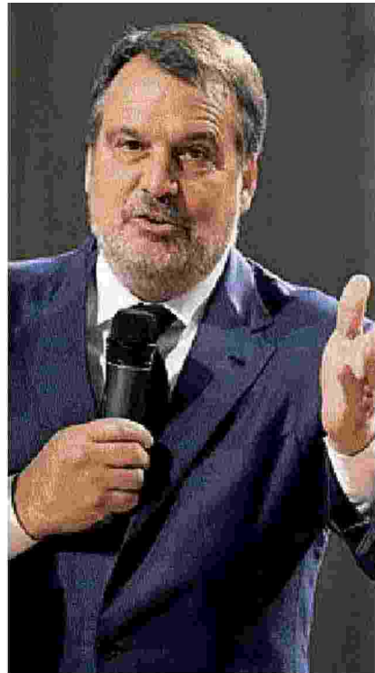
Marco Tardelli parlerà domenica in piazza Duomo

Fino al 30 maggio revocato il divieto di sosta per pulizia strade in via Abbi Paziienza, via del Carmine, via delle Pappe, piazza Giovanni XXIII, via F. Pacini, via Palestro, via Cavour, via B. Buozzi, via Curtatone e Montanara