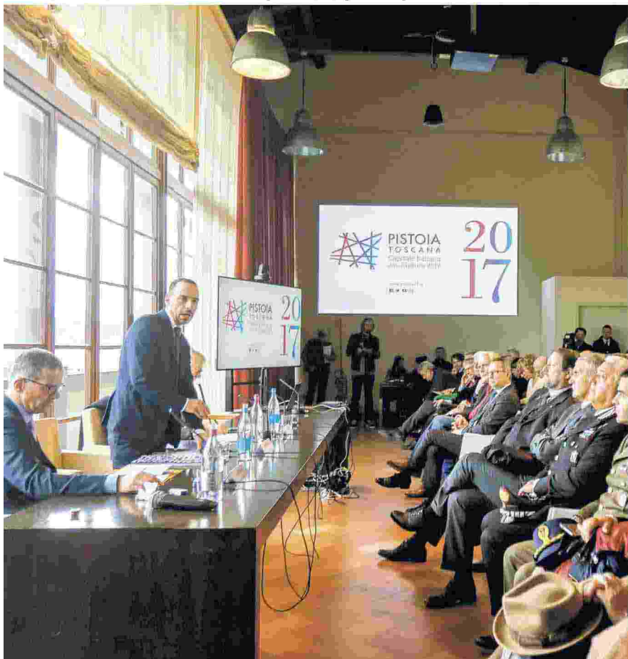
Ritaglio stampa ad uso esclusivo del destinatario, non riproducibile.