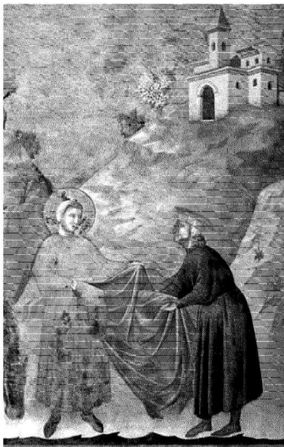
Giotto, Storie di San Francesco, Assisi: il dono del mantello