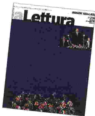
La copertina del numero 234 della Lettura disegnata da Taryn Simon

● Sul canale de la Lettura ( corriere.it/laletatura ) video, photogallery e approfondimenti sui contenuti del numero