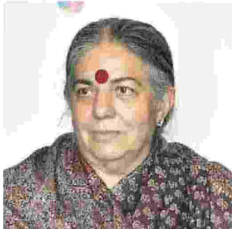
Vandana Shiva sul palco con 'Impariamo a condividere'

La fisica indiana Vandana Shiva ha ricevuto il 'Premio Internazionale'