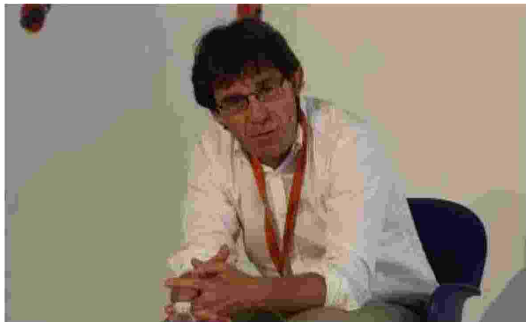
L'antropologo Adriano Favole domani a Pistoia sul palco del teatro Bolognini

Ambiente , natura, cultura: come si trova l'equilibrio e che contributo può dare l'antropologia nel dibattito? «L'antropologia ha indagato società che alcuni chiamavano 'popoli della natura'» spiega Favole. Una definizione pressoché spregiata, riferita a società primitive, incapaci di evolversi. Oggi questa espressione la stiamo rivalutando. Abbiamo tutte le possibilità